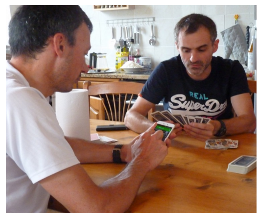
JM a trouvé une appli pour compter les scores au tarot, concentration maximum