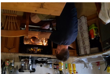
La bouffe c'est sacré